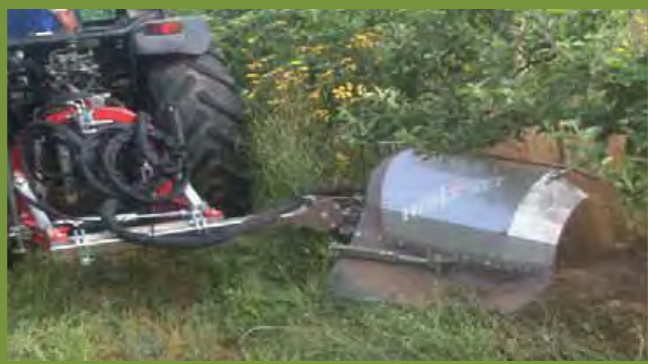
HERBANET SANS CENTRALE EN VERGER