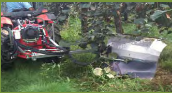
HERBANET SUR KIWI