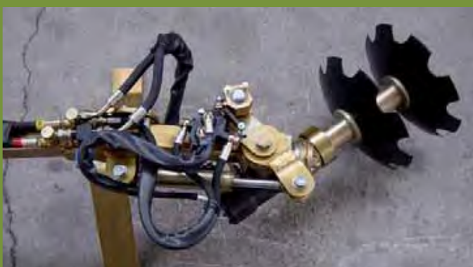
HERBANET DISQUE A RECHAUSSER