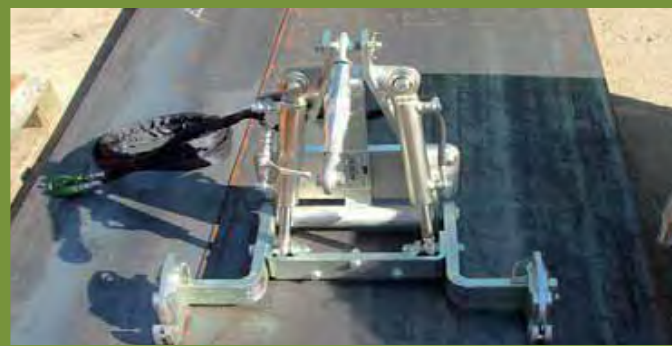
PORTE OUTIL HERBANET