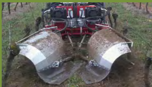
HERBANET VIGNE ETROITE 150 cm